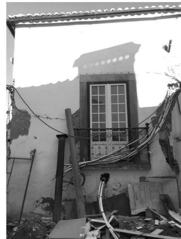
ANTES da intervenção