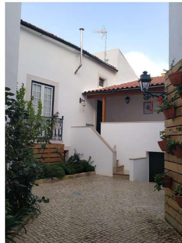
DEPOIS da intervenção