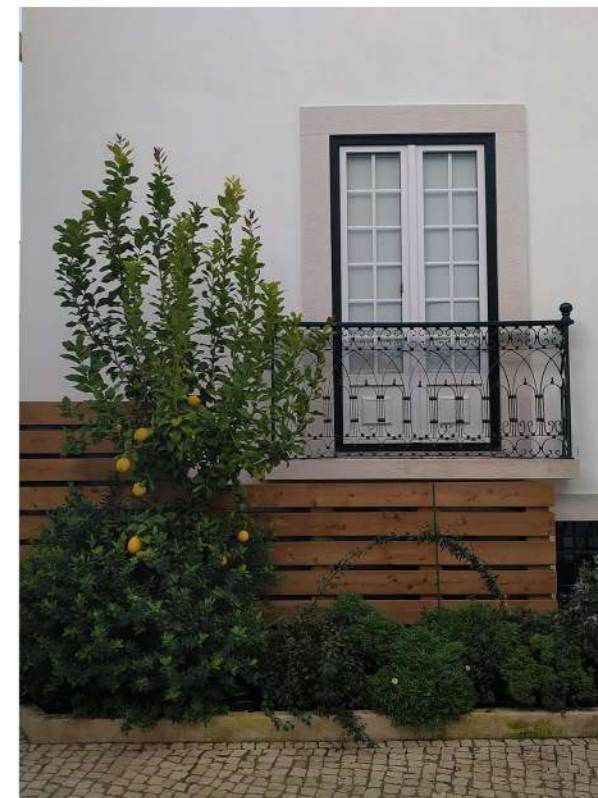
DEPOIS da intervenção