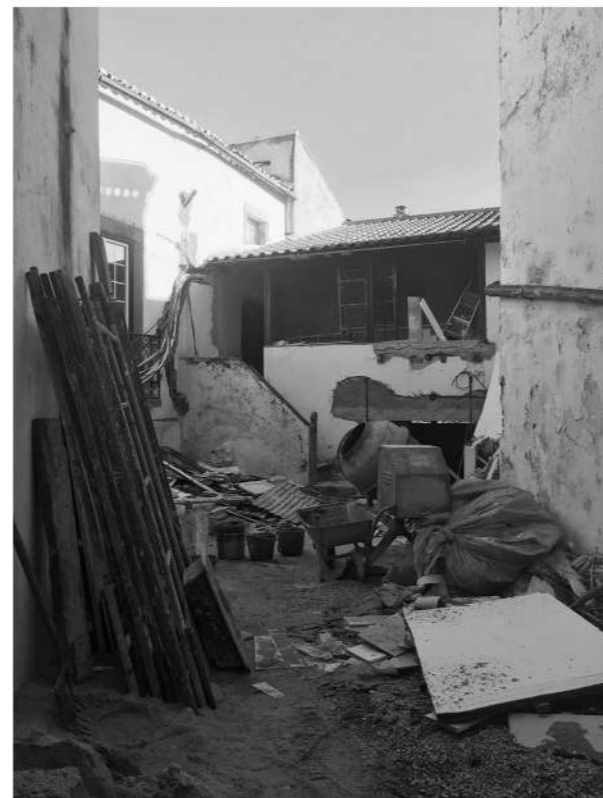
ANTES da intervenção