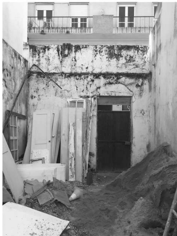
ANTES da intervenção