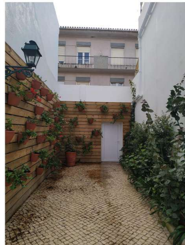
DEPOIS da intervenção